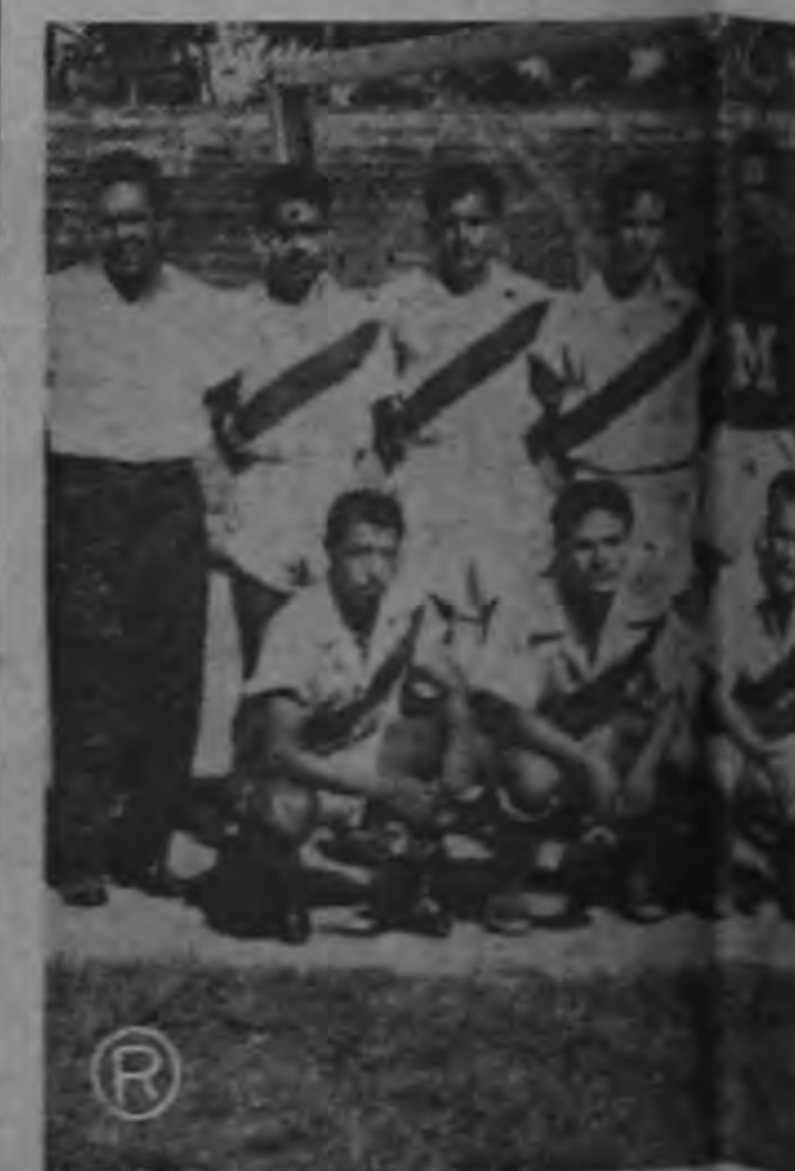
Este es el equipo salvadoreño que derrotó por tres a cero al seleccionado internacional del viernes pasado, muy notoria.