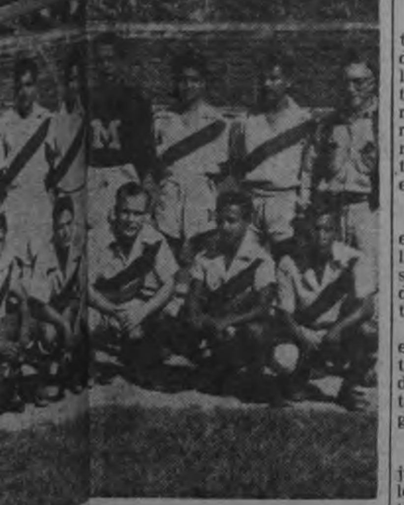
Municipal de Abuchapan, Panamá en el partido después de dominar en forma.

Superaron en su propio estadio todos sus hombres una destacada labor. — Superaron en su propio estadio todos sus hombres una destacada labor. — Superaron en su propio estadio todos sus hombres una destacada labor. — Superaron en su propio estadio todos sus hombres una destacada labor. — Superaron en su propio estadio todos sus hombres una destacada labor.