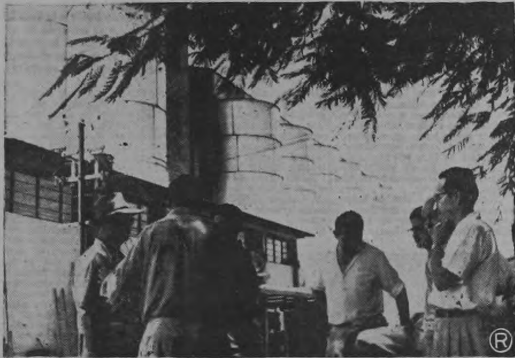
VISITA DE DIRECTORES Y GERENTES DEL CONSEJO NACIONAL DE PRODUCCION A LA BARRANCA — El sábado proximo pasado, los señores Directores y Gerentes del Consejo Nacional de Producción realizaron una importante visita de inspección a las instalaciones que esa Institución mantiene en Barranca. La gráfica muestra un momento de tal gira, pudiéndose observar a los nuevos Directores del Consejo mientras observaban la Planta de Silos allí instalada.

La Prensa está publicando los nombres de estas firmas en el anuncio de los concursos. Se espera para este año el mismo excelente resultado que se obtuvo el año pasado.