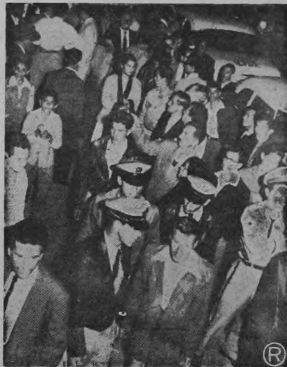
INTERRUPCION DEL TRANSITO POR DOS HORAS.—Tal era el aspecto que ofrecía el domingo en la noche una sección del Paseo Colón, frente a la Casa Libanesa, poco después de haberse registrado, el atentado contra miembros de la R. P. El tránsito en la importante arteria se vió paralizado por más de dos horas.