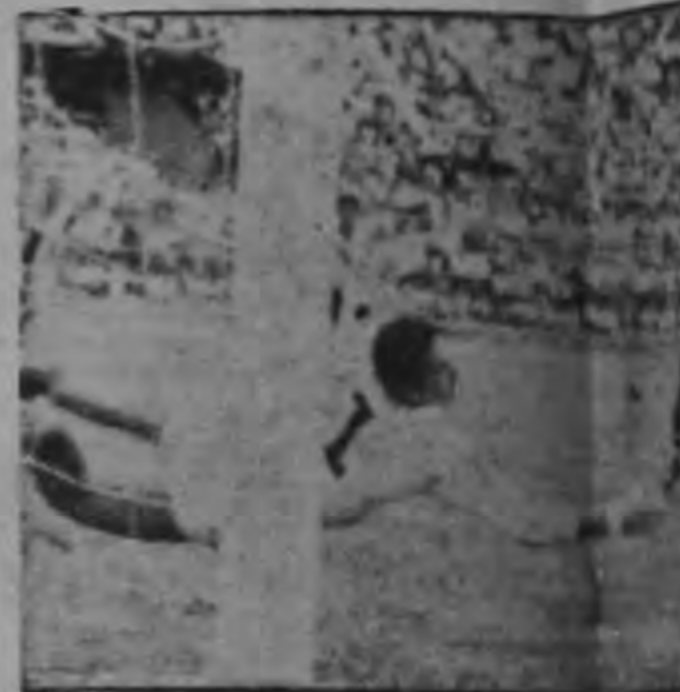
PORTERO LIBERTO RECHAZA: Herediano rechazó un fuerte balonazo de Danilo Montero con la caída de su portería. Hernán jugó el balón.

El segundo tiempo lo arbitró el guardalíneas París. Nica Alpizar entró en la atacante liberto y el asunto cambió para los decanos. El Herediano, lejos de cuidar el