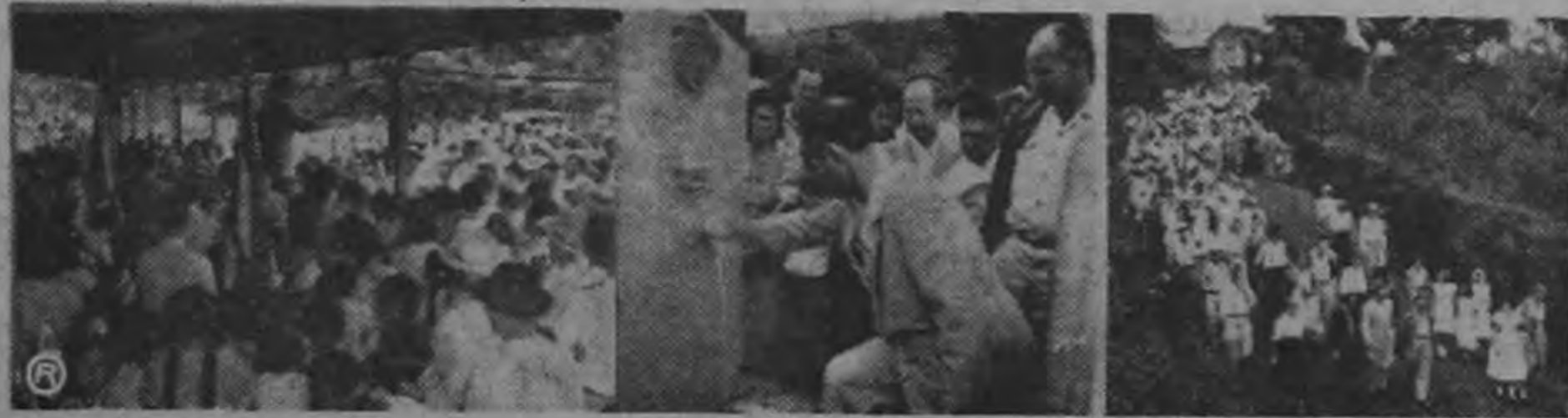
MAS ESCUELAS Y PLAZAS DE DEPORTE. La composición gráfica muestra, a la derecha, la Escuela de Candelaria, y a la izquierda, la Escuela de San Antonio de La Cueva, ambas del cantón de Naranjo, que fueron entregadas al servicio del país, el domingo pasado por el Gobierno de Figueres. Obsérvese en primer término la plaza de deportes que también ha sido construída por la actual administración. Estas son unas de las 13 obras que se inauguraron el domingo.

LA 'FETRABA' HA INTENTADO LLEGAR A UN ENTENDIMIENTO CON LA CHIRIQUI LAND CO.