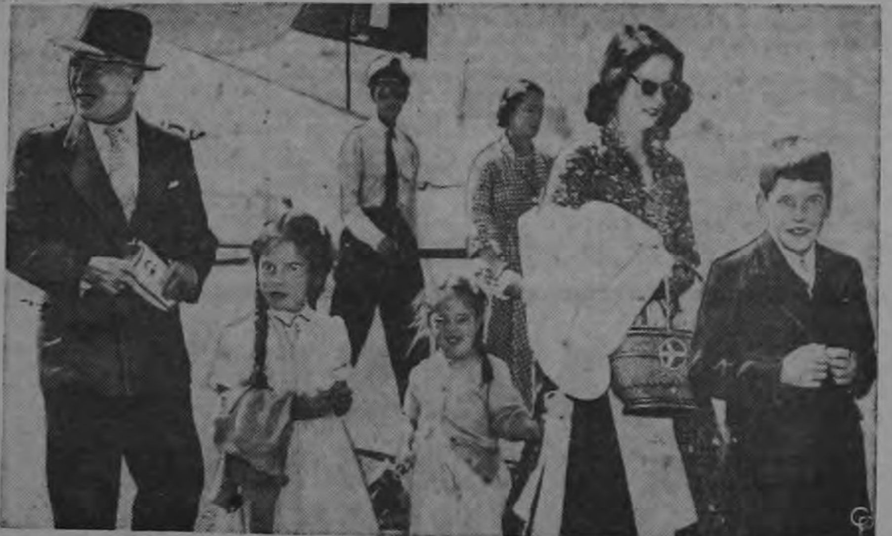
Charlie Chaplin que reside ahora en Suiza aparece con su esposa y sus tres niños al llegar a Niza, Francia, procedentes de Ginebra. Pasarán unas vacaciones en la Riviera Francesa y después Chaplin irá a París para supervisar el corte de una nueva película.