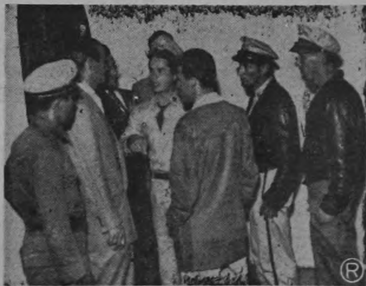
AUTORIDADES DISCUTEN.—Frente a la residencia en que permanecieron ocultos dos de los agresores de la Guardia Civil que se caparon inmediatamente. Miembros de la R. P. discuten con residentes y amigos de la citada casa. Se presume que la persona que hirió al Sargento Jiménez fuere uno de los que aquí se ocultó.