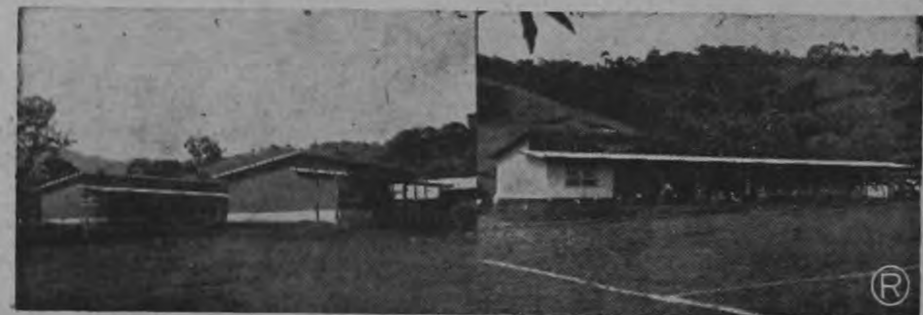
INAUGURACIONES DEL DOMINGO:— La gráfica de la derecha presenta un instante de las trece inauguraciones llevadas a cabo el domingo pasado en el Cantón de Naranjo. Al centro aparece el Presidente Figueres inaugurando la cañería de San Antonio y a la izquierda, un aspecto de la comitiva oficial, recibida por el pueblo de San Antonio, en el momento en que arribó a la localidad.