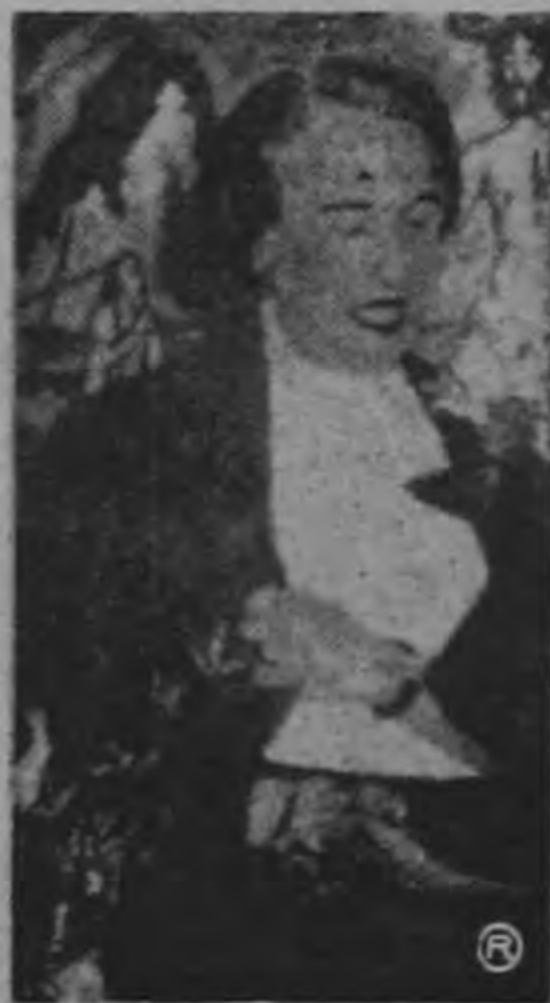
Victoria Ocampo se solidariza con el escritor venezolano Rómulo Gallegos, a quien la tiranía de Pérez Jiménez ha proscrito de su patria