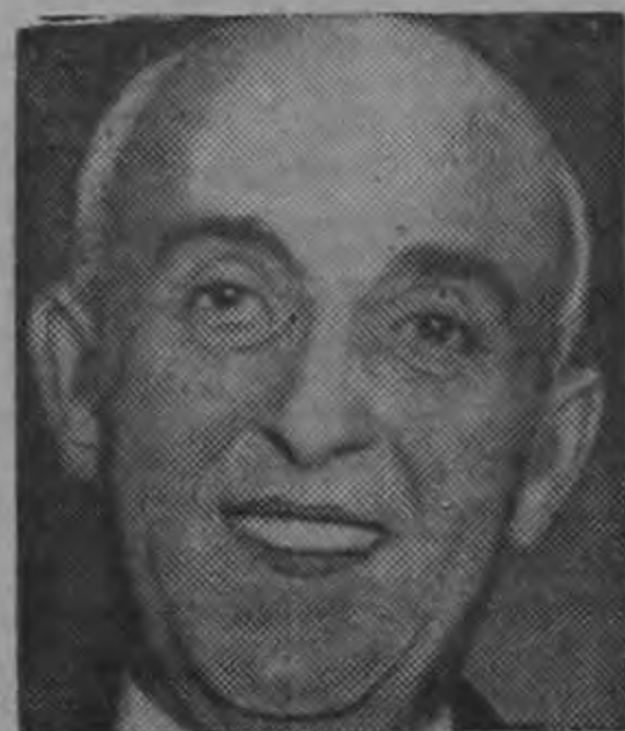
PRESIDENTE PRADO ...Libertad de prensa...